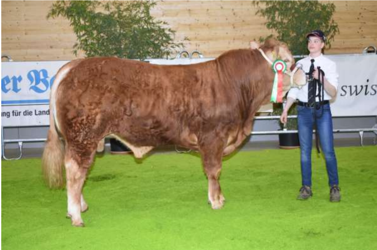
Sieger Kategorie II (2003 – 2006)