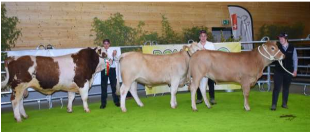
Siegerbild Kategorie III (1999 -2002)