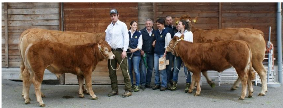
Bianca v Nizza 2017