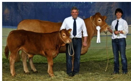
Perle vv Odette 2012