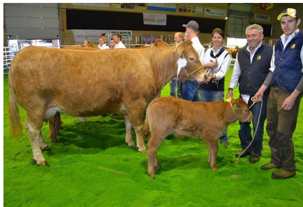
Nizza v Coni 2010 Nizza v Coni 2010