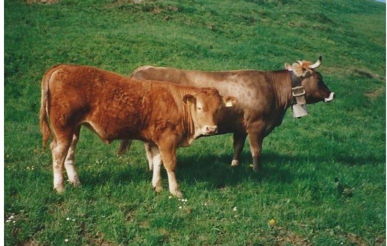
50%LM Stern mit Kuhkalb 75%LM Coni (LM Champion 2006)

Von der 100%LM Kuh FR Odette, die wir 2000 in Cazis ersteigert haben, stammen die restlichen Kühe ab.