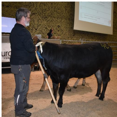
Grauvieh x Limousin