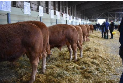
Vorbereitungen im Stall...