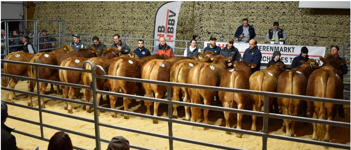
Zwölf Zuchtbetriebe traten zur Championwahl an